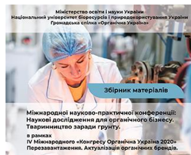
Міжнародної науково-практичної конференції: Наукові дослідження для органічного бізнесу. Тваринництво заради ґрунту. в рамках IV Міжнародного «Конгресу Органічна Україна 2020» Перезавантаження. Актуалізація органічних брендів.