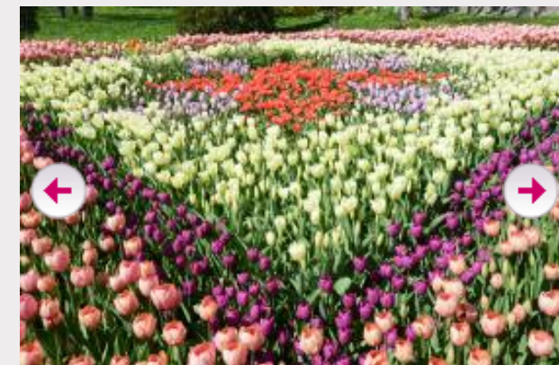
ЦВЕТОЧНАЯ ВЫСТАВКА "ТАЙНЫ ПАСХАЛЬНОЙ ПИСАНКИ" В КИЕВЕ